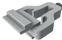
Vertikale Klemmkombination Art.-Nr. 11105-05