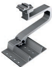
SL Alu 3D Dachhaken Art.-Nr. 13135-01