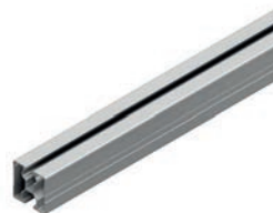
Rail 40/60 Art.-Nr. 81140-2400

*Es gelten unsere Garantiebedingungen. Diese sind jederzeit im Internet einsehbar unter www.sl-rack.de .