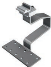
SL A2 Dachhaken Art.-Nr. 11100-01